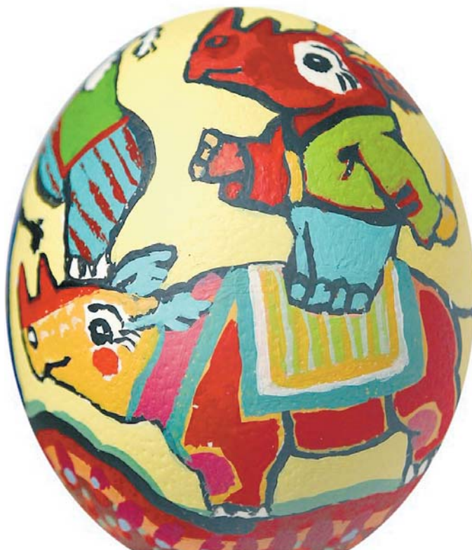
Fröhlich: Ei mit Nashörnern von Simon Dittrich.

Ab sofort kaufte er nur noch Gemälde, wenn sich die Künstler gleichzeitig bereit erklärten, ein Straußenei zu gestalten. Überrascht, aber „zu